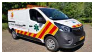
Dieren Transport Ambulance Dieren Noodhulp Ambulance Dieren Ambulance

Zorg bij het invullen van het formulier vooral voor een gedegen onderbouwing: maak goed duidelijk waarom u een dierenambulance nodig heeft, wat het belang van die (extra/nieuwe) ambulance is bij het werk voor de dieren en hoeveel kilometers u op jaarbasis verwacht te rijden. De aanvraag kan per post (zie achterzijde voor het adres) of ingescand per mail verzonden worden aan dierenorganisaties@dier.nu