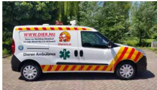
Dieren Noodhulp Ambulance