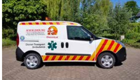
Dieren Transport Ambulance

Vanzelfsprekend wordt er een overeenkomst opgesteld waarin het ge-