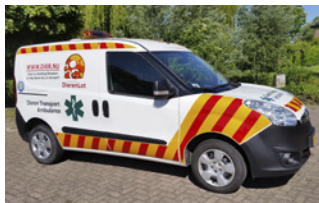
Dieren Transport Ambulance