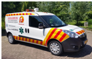
Dieren Noodhulp Ambulance