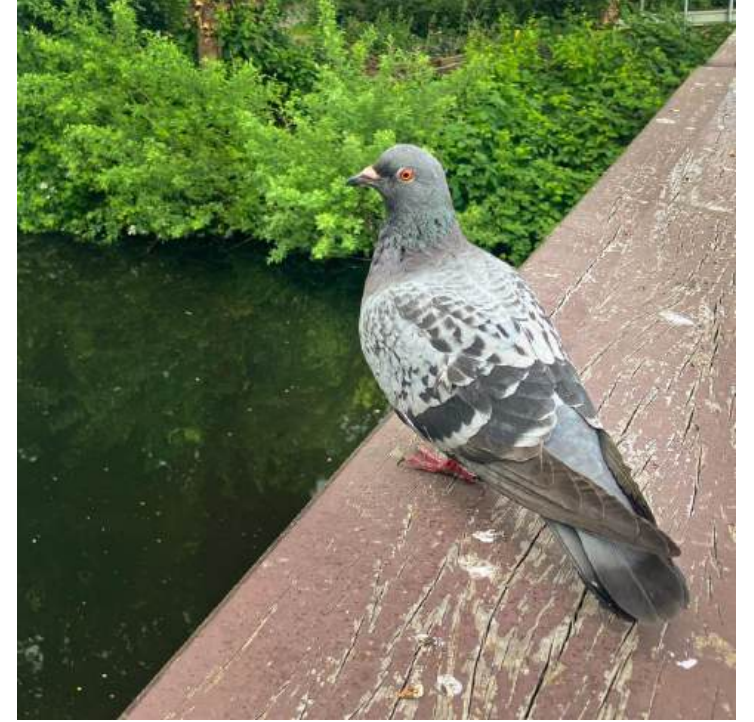
Stadsduif Columba livia (domestica)